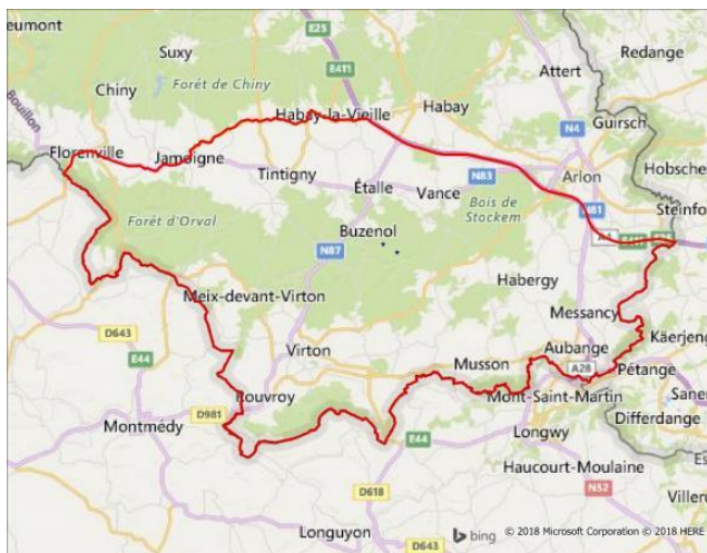
Gefährdetes Gebiet in Belgien

In Belgien wurde ein gefährdetes Gebiet mit einer Größe von 630 km 2 um den Ort Étalle ausgewiesen. Dieses grenzt im Osten bis an die Luxemburgische Grenze und im Süden an Frankreich an.